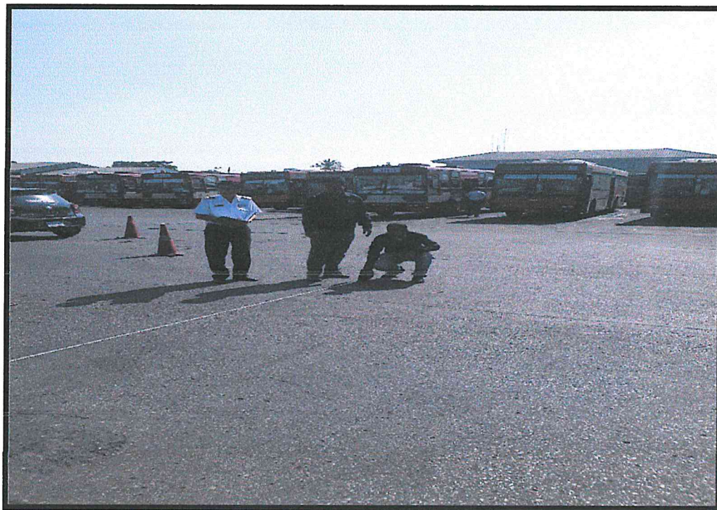
ก๊ลังลานจอดรถ