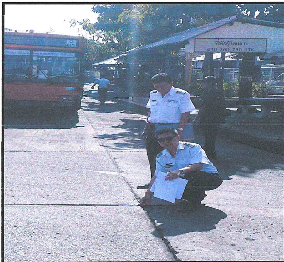
ประตูทางเข้า