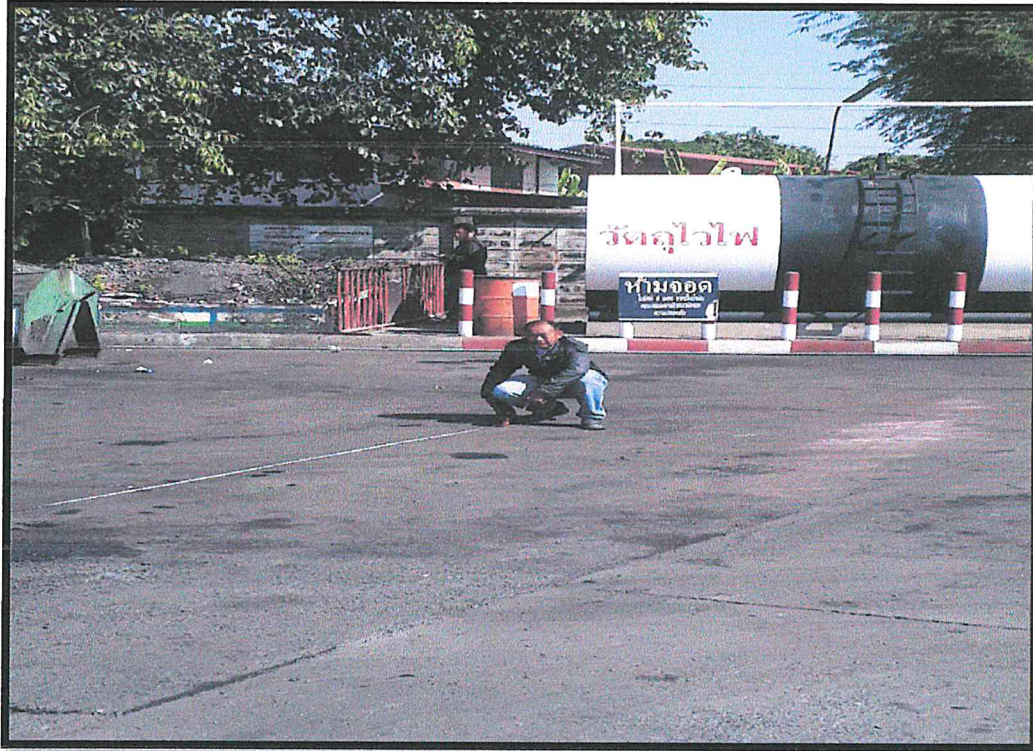
บริเวณรั้วปั้มน้ำมัน