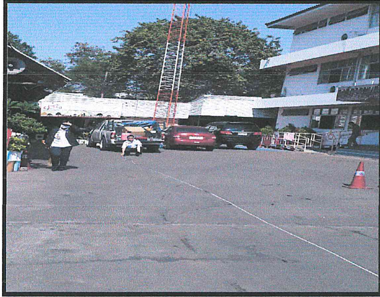
หน้าสำนักงานเขตการเดินรถที่ 8 และกลุ่มงานปฏิบัติการเดินรถ 3